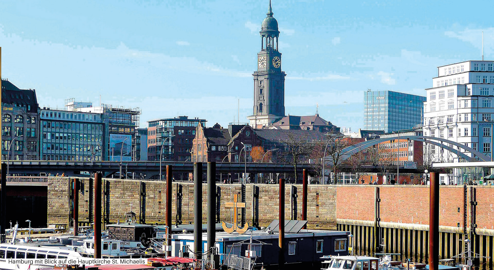
Hamburg mit Blick auf die Hauptkirche St. Michaelis