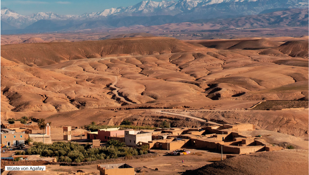
Wüste von Agafay