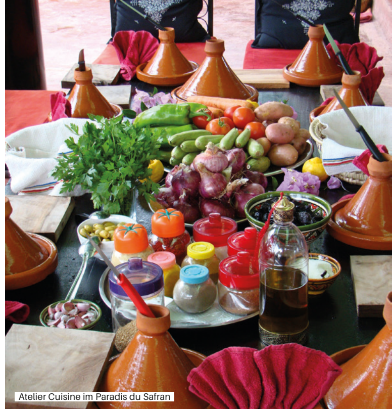
Atelier Cuisine im Paradis du Safran

Zunächst erfolgt die Fahrt zur Safranplantage „Le Paradis du Safran“, die vor einigen Jahren von der Schweizerin Christine Ferrari gegründet wurde. Die Blütezeit der Safranpflanzen liegt Ende Oktober, die Ernte erfolgt Anfang November. Doch auch außerhalb dieser Zeit erhalten Sie einen umfassenden Einblick in Anbau, Pflege, Ernte und Verarbeitung dieses kostbaren Gewürzes. Zur Anlage gehört zudem ein liebevoll gestalteter Obst- und Kräutergarten mit zahlreichen südländischen Pflanzen und Früchten.