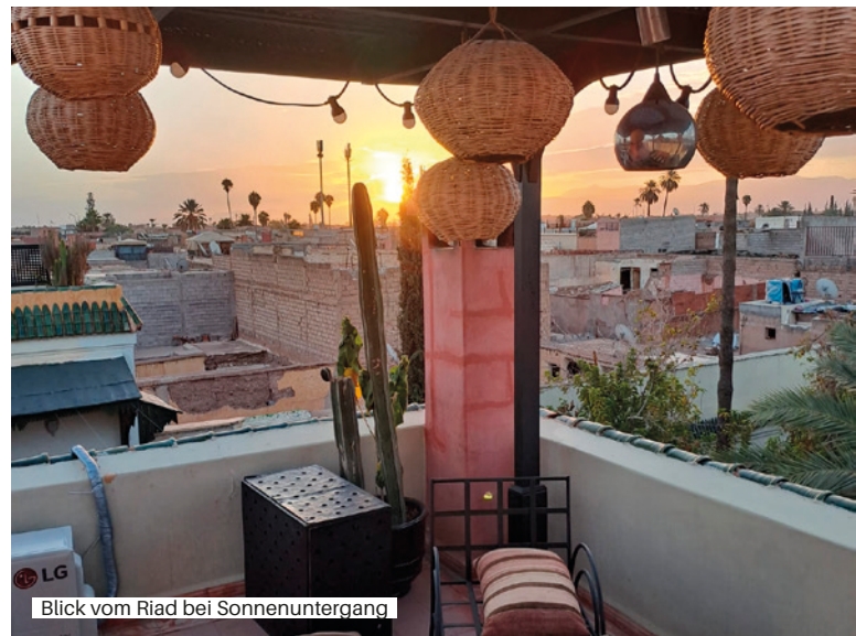
Blick vom Riad bei Sonnenuntergang

Ein in den 1920er-Jahren vom Künstler Jacques Majorelle angelegter botanischer Garten, später von Yves Saint Laurent gestaltet. Exotische Pflanzen, Bambushaine und das leuchtende Majorelle-Blau schaffen eine besondere Atmosphäre.