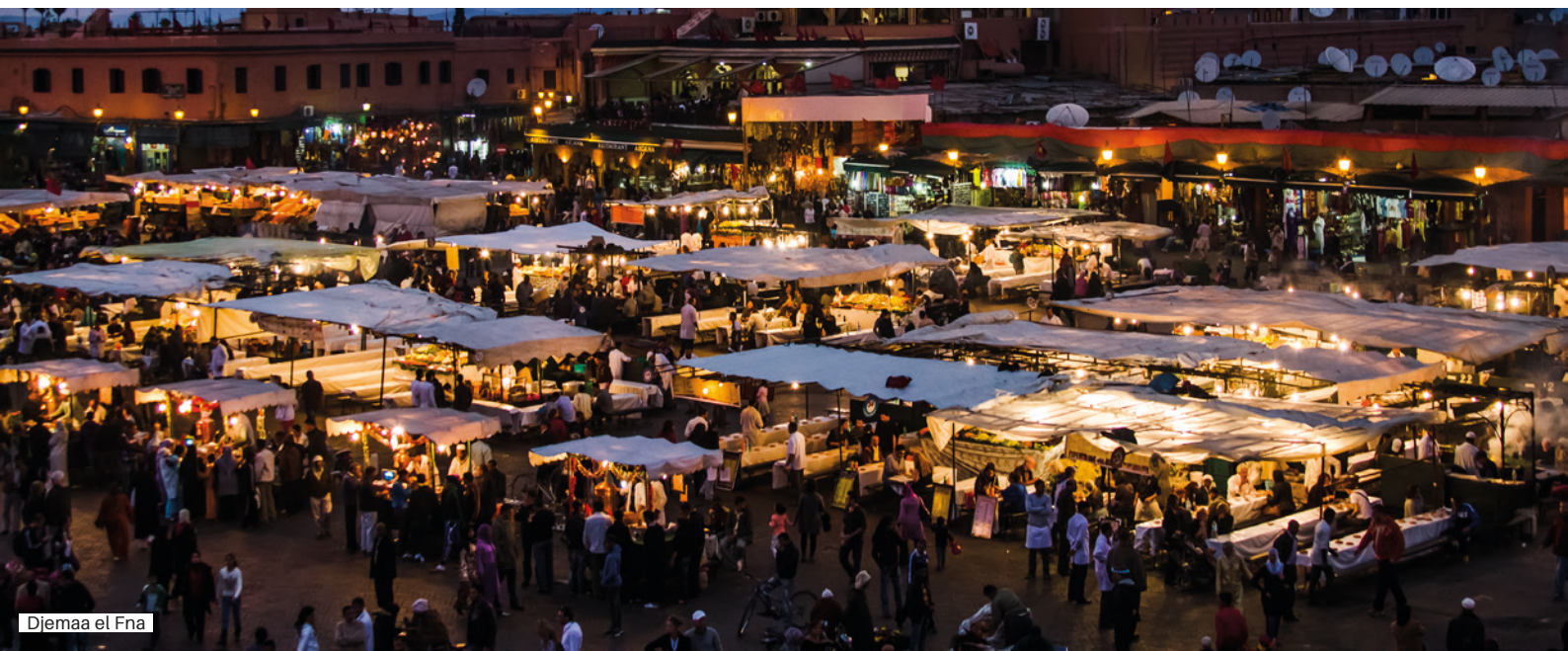
Djemaa el Fna

Nach Ankunft am Flughafen Marrakesch erfolgen die Erledigung der Zoll- und Ausreiseformalitäten. Anschließend treten Sie den Rückflug nach München an. Rückreise nach Tirol.