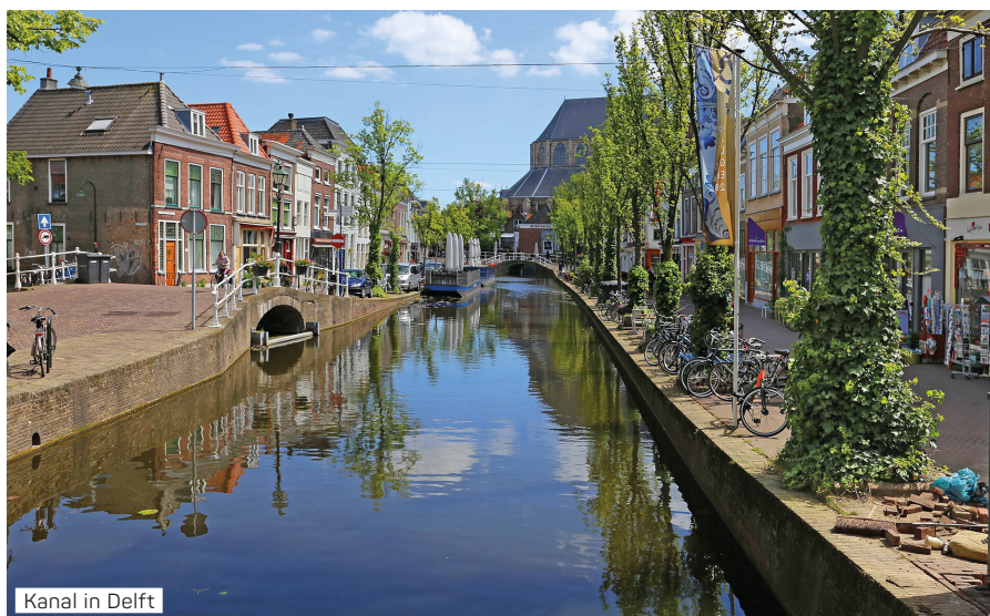
Kanal in Delft

Genießen Sie einen erholsamen Seetag und lassen Sie sich an Bord rundum verwöhnen.