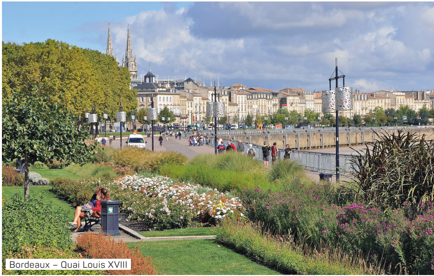
Bordeaux – Quai Louis XVIII