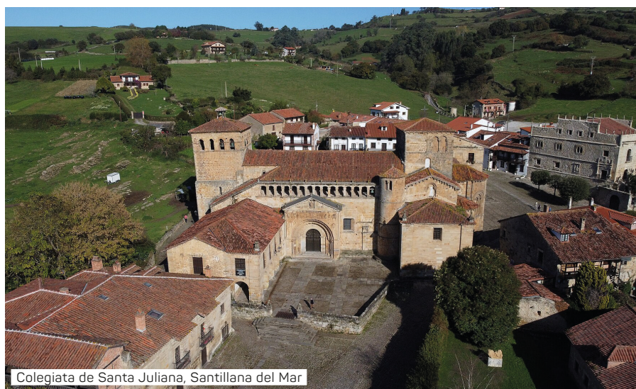
Colegiata de Santa Juliana, Santillana del Mar

Für die Qualität der Ausflüge sind wir nicht verantwortlich, wir vermitteln diese lediglich! Änderungen der Preise und inhaltliche Abfolge sind der Reederei vorbehalten.