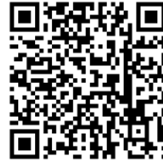
Google Play Store